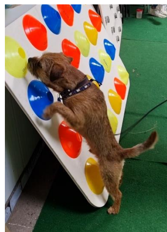
Buck de borderterriër tijdens detectie neuswerk.